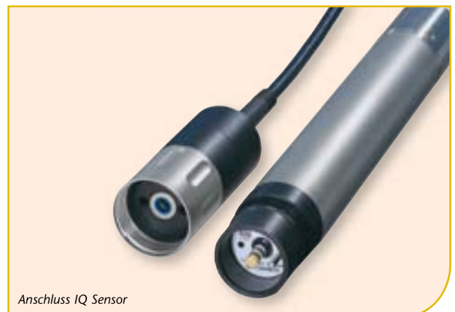
Anschluss IQ Sensor